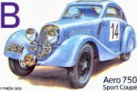
Aero 750 Sport Coupé