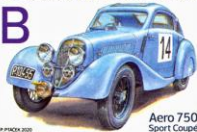
Aero 750 Sport Coupé