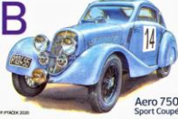
Aero 750 Sport Coupé