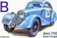
Aero 750 Sport Coupé