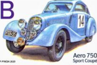
Aero 750 Sport Coupé