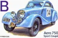
Aero 750 Sport Coupé