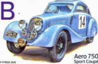
Aero 750 Sport Coupé