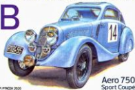
Aero 750 Sport Coupé