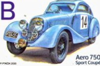
Aero 750 Sport Coupé