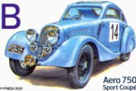
Aero 750 Sport Coupé